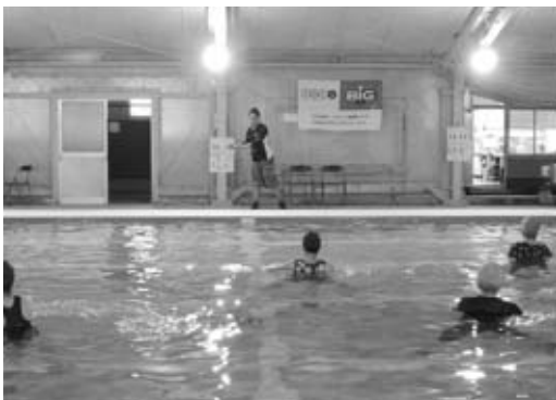
並里講師による熱心な指導