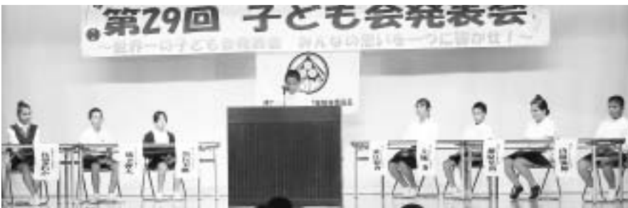
各区子ども会の実践報告をしました。

第二部の実践発表では、各区子ども会の会長が、自分たちの区の子どもの会の特徴や、会長になって成長できたことなどを自信たっぷりに発表しました。子ども会活動を通してみんな、最上級生としての自覚をしっかりと身につけました。