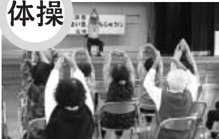
講師の掛け声にあわせて、まずは準備体操