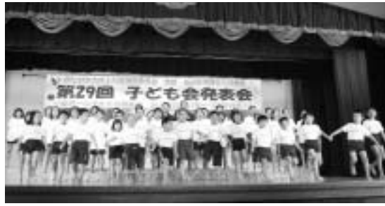
西江上区子ども会による「雨降花染」

十二月六日(日)に第二十九回子ども会発表会が「世界一の子ども会発表会 みんなの思いを一つに響かせ!」というテーマで盛大に開催されました。