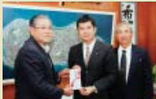
大同火災海上保険株式会社様