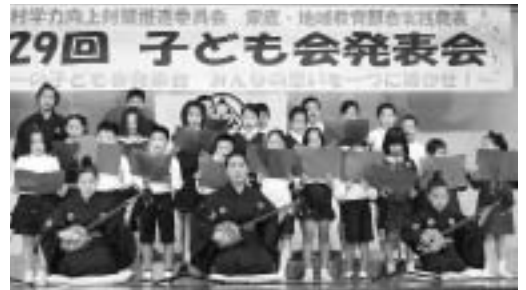
阿良区子ども会による「砂持節」

第二部の舞台発表では、自由演技と民俗芸能の二部構成で、自由演技では「砂持節」や「雨降花染」などの地元曲の合唱や空手・獅子舞など、各区とも工夫を凝らした演目を発表してくれました。