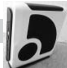
ゆんたくボックス