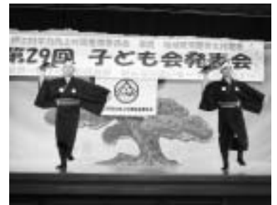
西江上区子ども会による「笠吉田」

民俗芸能の部では、地域の方の厳しい指導の中、新しい踊りに挑戦したり、みんなで動きを揃えたりと、一生懸命に練習した成果を披露しました。その表情は堂々としていて、観に来てくれたお客さんを感動させました。