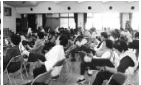
肘と膝をくっつかずようにももを上げて！

講師は「介護予防は閉じこもり予防でもあるのです。」と言われていましたが、この会場に来られた皆さんはすでに介護予防しているということなのです。また、「長寿になるにはそれに見合うだけのトレーニングをして体力の貯蓄を増やす必要がある」といわれたことも印象的でした。それに応えるかのように参加された皆さんは一生懸命腕を上げ、脚を上げ、体操に励まれていました。高齢者がいつまでもいきいきとがんじゅうに暮らしていくためには、体力低下そして生活機能の低下を起こさないようにすること、それには積極的に体操などの運動をすることが大切だということを再確認したひとときだったのではないのでしょうか。参加された老人クラブ連合会の皆さん、お疲れ様でした。