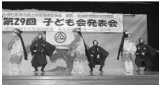
東江上区子ども会による「シティナ節」