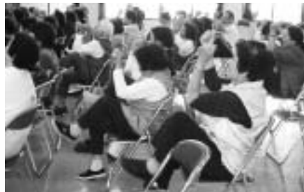
脚、どこまであがりますか？