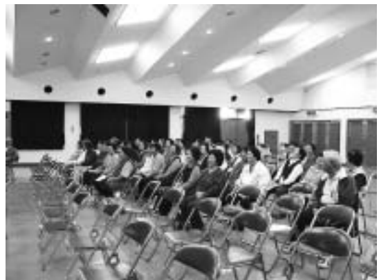
講師のわかりやすく面白い話に笑いがおこり 始終なごやかなムード

加齢による体力低下は誰にでもおこり、自然の低下に加えて、 使わないことによる低下 （いろいろな理由で活動することが減り、筋力が低下する）がとくに大きな影響を及ぼしている。