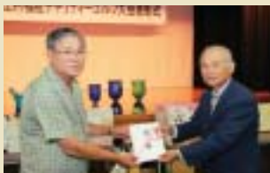
福祉チャリティー実行委員会様