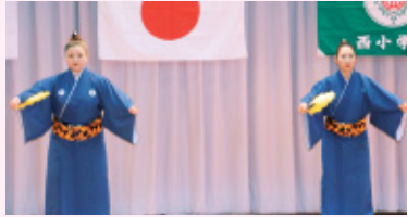
幼稚園児保護者によるかぎやで風で祝賀会スタート