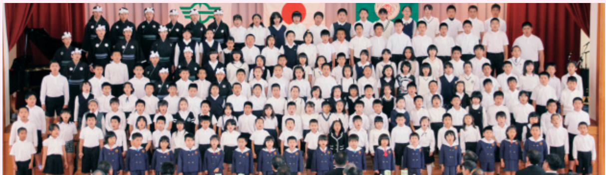
園児、児童全員で伊江村歌等を斉唱しました