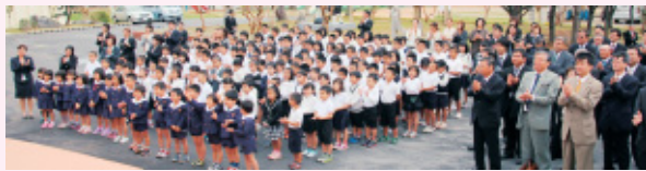
テープカットを児童関係者全員で祝いました。