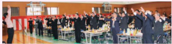
万歳三唱で校舎の完成を祝いました。