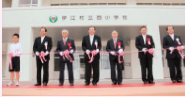
関係者によるテープカット

2月16日に行われた西小学校新校舎、西幼稚園新園舎落成式典及び祝賀会の様子を紹介します。