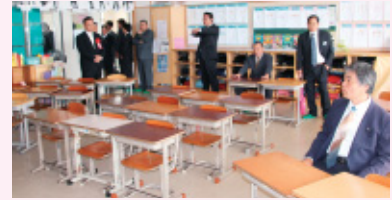
校舎見学、懐かしい小学校時代を思い出します。