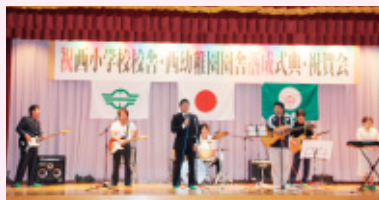
すばらしい演奏と歌声で会を盛り上げました。