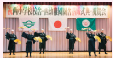
5年生による「伊江島の村踊」を披露