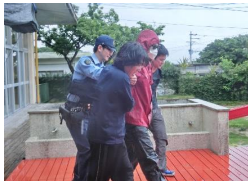
無事、パトカーに乗せ、連れていきました。