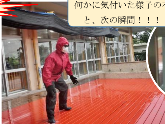
何かに気付いた様子 of 不審者。と、次の瞬間!!!!!!