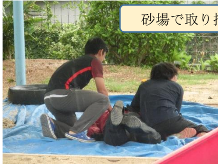
砂場で取り押さえ・・・連行