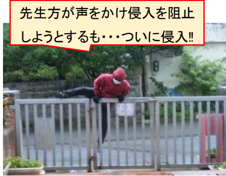
先生方が声をかけ侵入を阻止しようとするも・・・ついに侵入!!