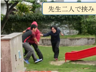
先生二人で挟みうち!!