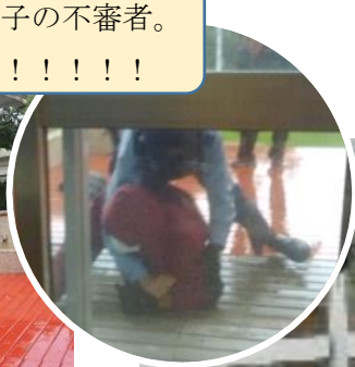
一瞬のうちに押さえ付け・・・侵入者、身動き取れず!!