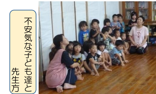
不安気な子ども達と先生方