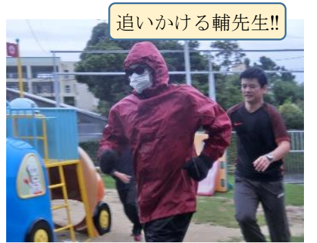
追いかける輔先生!!