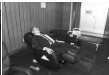
マッサージチェアで疲労回復！！