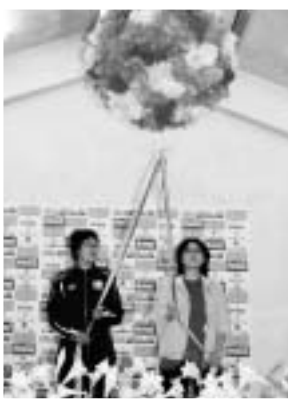
お誕生日おめでとう