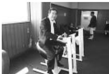
ジョーバで腰痛予防！！