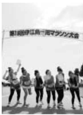
記録証とったどー