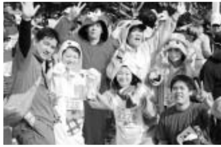
暑いけどこれからスタート大丈夫？