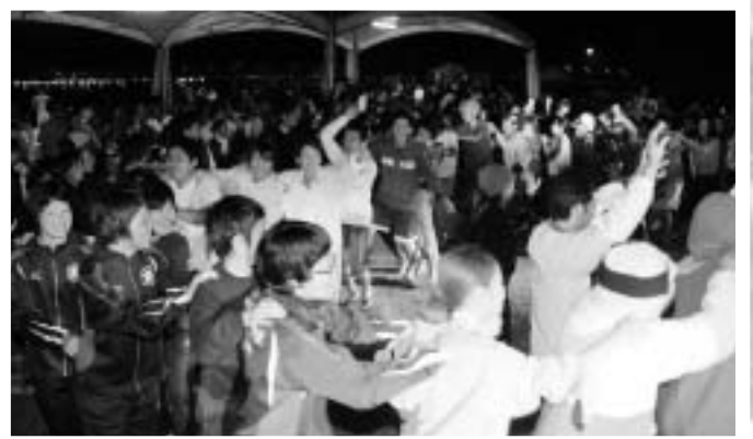
フィナーレは輪になって大盛り上がり

おわりに、村民沿道での大きな声援として、ボランティアの皆様、協賛企業等のご協力により盛会裏に終える事ができました。心より感謝申し上げます。