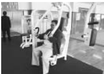
体指会長はパワーアップ！！

若者、婦人、老人、幅広い世代の 競技力向上・ダイエット・健康増進に ご利用下さい