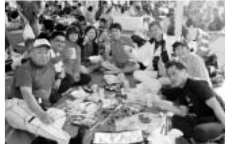
走り終わったあとのビールは最高！