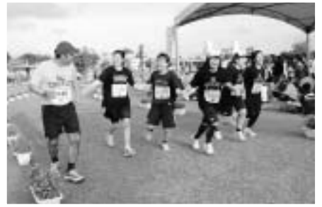
仲良くみんなでゴール