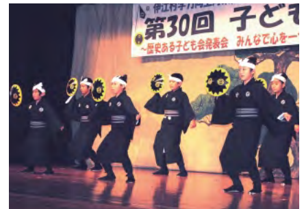
阿良区子ども会「笠様は」

子ども会活動を通して学んだことや、支えてくれた方々への感謝の気持ちを子ども会代表が発表し、学力向上対策推進委員会(家庭・地域教育部会)による高校生在学調査の発表が行われました。舞台発表では、子ども会全員で取り組む自由演技と、高学年が中心となる民俗芸能の発表がありました。自由演技では、ダンスや合唱など、どれも各区の特色が出た、すばらしい発表となりました。民俗芸能の部では、地域の方々のご指導のもと、一生懸命練習してきた成果を披露しました。