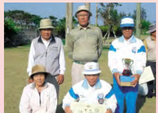
地元開催優勝を飾った阿良Aチーム 3位に輝いた川平チーム