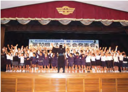
川平区子ども会 合唱「あとひとつ」