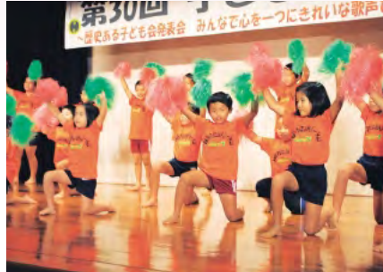
西崎区子ども会 ダンス「ペコリナイト」