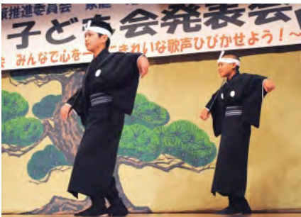
西江上区子ども会 「雨降花染」