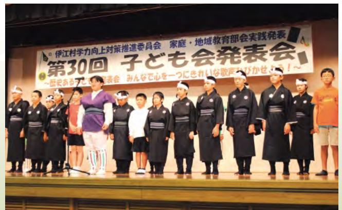
準備や当日の運営まで頑張った子ども会リーダーたち