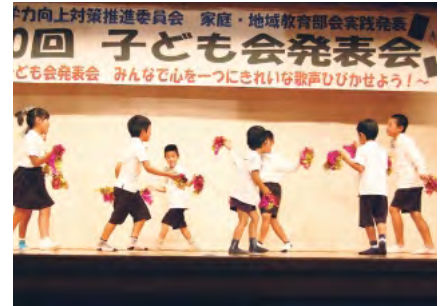
真謝区子ども会 ダンス「クマアッハ」