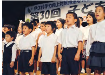
東江前区子ども会 合唱「まなざし」