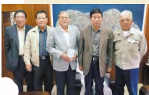
← 野村流 古典音楽保存会 伊江支部 様