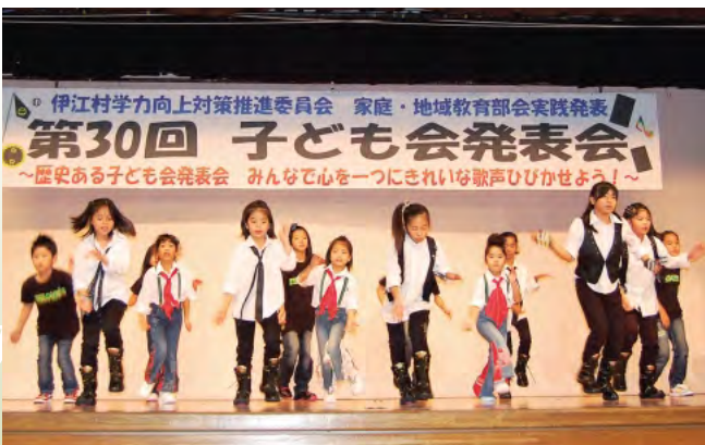
会場を沸かせた、かっこいいダンス!

また、今回は第30回を記念して、県内で活躍中のキッズダンスチーム“Fun Klover”のスペシャルステージがあり、とても盛り上がりました。