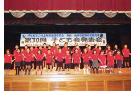
東江上区子ども会 合唱「愛唄」