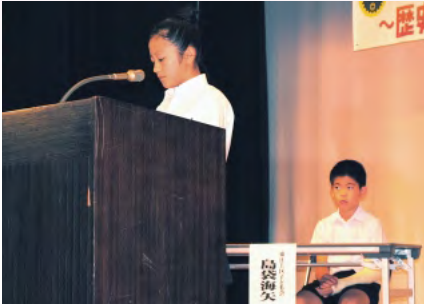
子ども会会長による実践発表

12月5日(日)に第30回子ども会発表会が「歴史ある子ども会発表会 みんなで心をつにきれいな歌声ひびかせよう」というテーマの下、開催されました。昭和56年に東江上区、川平区に子ども会が結成され、スタートした子ども会発表会が今年で30回を迎えるという記念ある発表会となりました。