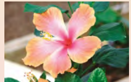
←大人顔負けのスコア！ ゴルフ大会の上位入賞者達