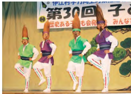
西江前区子ども会による「アカキナ」