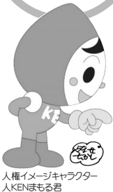
人権イメージキャラクター 人KENほもる君