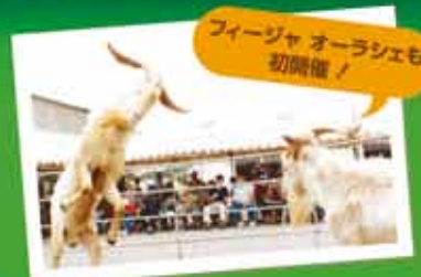
フイジャ オーラジエシ 初開催!