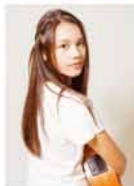
シンガーソングライター