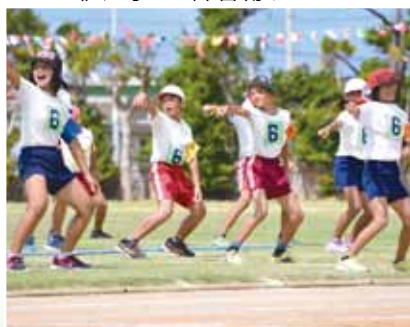
のりのり「パーフェクトヒューマン」