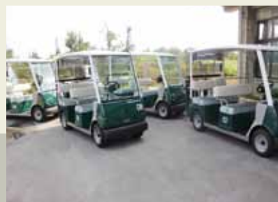
村民レク広場備品購入事業（乗用カート等）