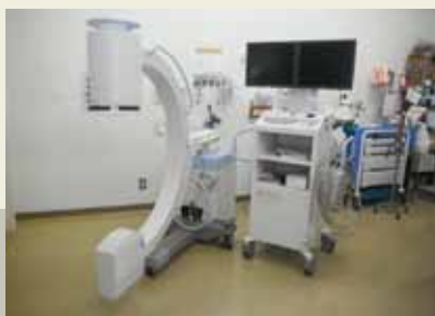
外科用X線装置購入