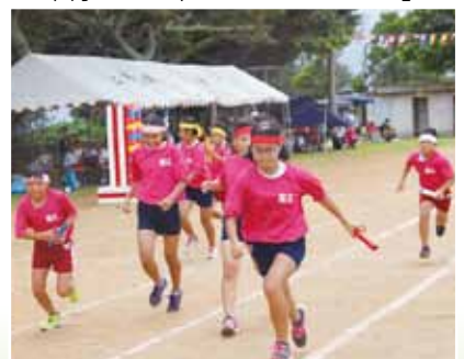
西小6年リレー「ラストラン」