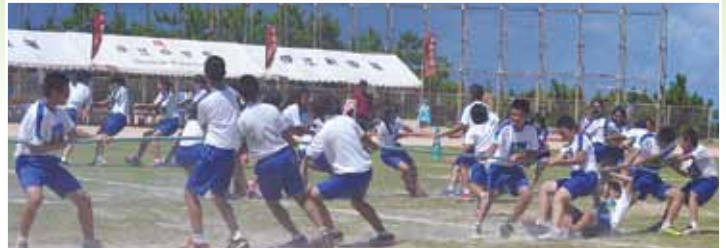
伊江中2年による5色綱引き