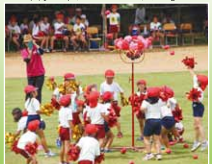
西小1・2年「なかよし玉入れ」