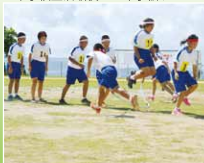
中学1年生縄跳びリレー