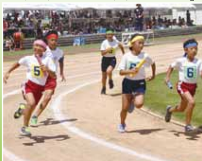
伊江小5年VS6年総力リレー