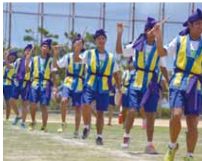
伊江中全校生徒によるエイサー