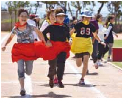
伊江小PTA障害物リレー