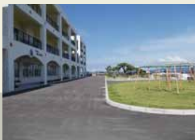
伊江小学校校庭整備工事