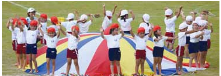
にしよっこ 力を合わせて パワー全開!!