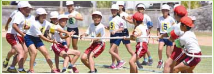
伊江小5・6年生紅白対抗5色綱引き

天候は快晴だったり、通り雨が降ったりしましたが、運営に大きく影響することなく、こどもたちは大粒の汗をかきながら、練習の成果を披露し、会場から大きな拍手や声援が送られ大いに盛り上がりました。