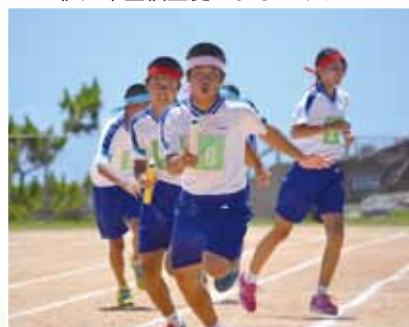
中学校生活最後の3年学級リレー