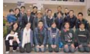
世界のイージマンチュ交流派遣事業

等を実施し、また人材育成事業として学習支援員の配置、大会派遣助成を行いました。また、産業振興、環境保全、医療環境充実、情報通信強化、文化財保全などの各分野で事業を実施しました。今年度も継続事業に加え、産業振興事業、環境保全事業、定住条件整備事業等の事業に取り組んでおります。