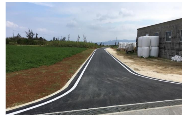
東江上集落道 21 号道路整備工事

平成 30 年度 特定防衛施設周辺整備調整交付金を活用した基金事業は次のとおりです。