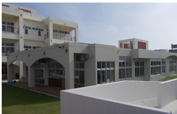
伊江村立幼稚園増改築整備工事