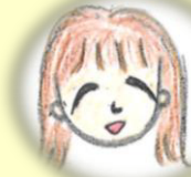
看護師：小橋川 英恵 (母子コーディネーター)