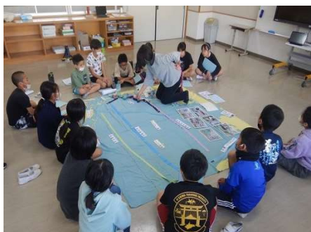
海岸ゴミを利用した環境授業