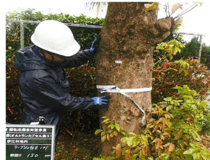
アカギ防除事業(薬剤注入)