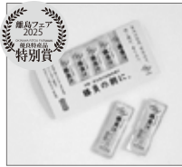
浜口水産株式会社 宮古島市 【勝負汁(7本入り)】