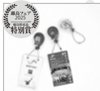
合同会社縄文企画 石垣市 【海洋ゴミから生まれた宝物 幸せのフィッシュフック】