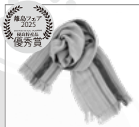
体験工房 yukui 竹富町 【ストール】