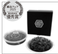
韓国鉄板料理 久ー韓 久米島町 【アーサー入りもずくキムチ】