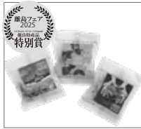
多良間島観光コンシェルジュ 多良間村 【多良間島かちわり黒糖】