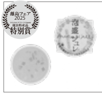
合資会社伊是名酒造所 伊是名村 【泡盛ジュレ】