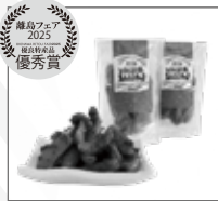
NOGU's 伊江村 【いしま便島らっきょうキムチ】