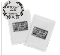
農業生産法人(有)サザンファーム 竹富町 【西表島のお米で作った から揚げ粉】