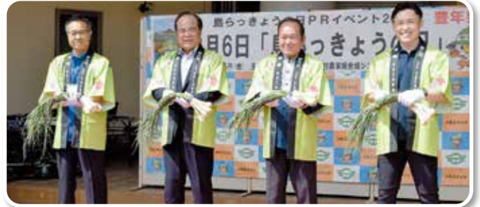
テープカットならぬ「島らっきょうカット」