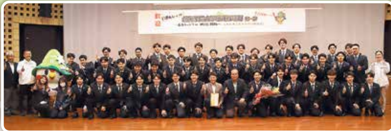
北海学園大学硬式野球部

今シーズンの飛躍を誓い、伊江島で猛練習に励み、キャンプ初日には伊江島はにくすにホールで歓迎セレモニーが開かれました。名城村長は「伊江島の自然豊かな環境の中で最高の準備ができるよう応援しています。ケガには注意して実り多きキャンプにしてください」と激励の言葉が贈られました。