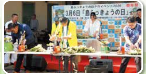
らっきょう束ね競争