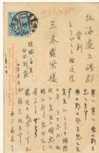
三木露風と上里春生の はがきのやり取り